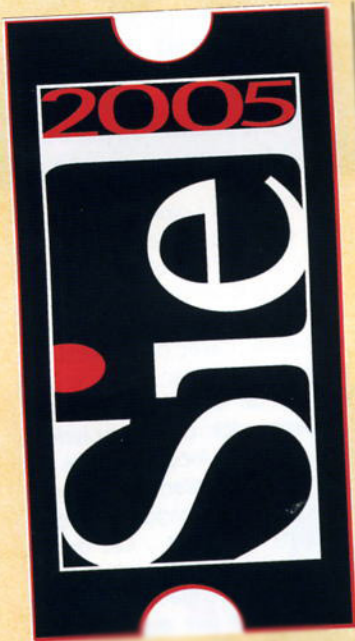
PARALUMIÈRE STAND 487

LES FILTRES Verres techniques dépolis colorés. Les 12 couleurs les plus populaires de la série des verres sont maintenant disponibles dans une nouvelle gamme réunissant couleur et diffuseur, permettant au concepteur lumière d'offrir les deux effets avec un seul verre. Le dépôt du film attrouct le passage de lumière et donne un effet plus uni et graduel. Marché cible : Eclairage architectural. Cette marque est présentée pour la 1 ère fois au niveau National